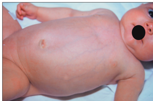
Obr. 3. Hepatosplenomegalie.

Na naší ambulanci jsme sérologicky a klinicky vyšetřovali tyto děti v intervalech: 2., 3., 6., 12. a 24. měsí věku (1) a dále individuálně podle výsledků. Sedm bylo kompletně sérologicky negativních (RRR, TPHA, FTA-ABS, ELISA, IgG, IgM, později WB IgG, IgM) od půl roku věku, 2 od 1 roku věku.