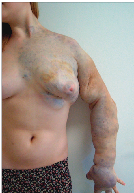
Obr. 4. Rozsáhlá venózní malformace levé horní končetiny a přilehlé části hrudníku.

Většinou terapie závisí také na lokalizaci. Malé léze mohou být léčeny perkutánní sklerotizací, někdy s násled-