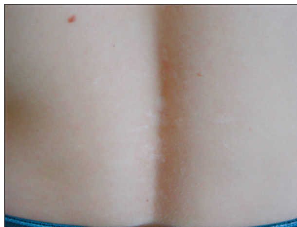
Obr. 3. SEB-Koebner: záda matky 2letého chlapce s atrofickými jizvami.