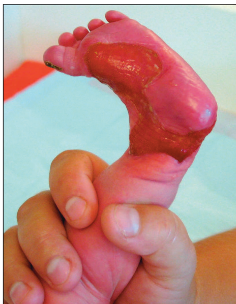
Obr. 5. Bartův sy – aplasia cutis.

stance vaziva i fibrilních struktur a bazálních membrán. Rozpouštění bazální membrány (LD – lamina densa) a průnik nádorových buněk přes tuto membránu se označuje jako invaze. Bez rozrušení BM (LD) by byl karcinom charakterizován jako karcinom in situ. Invazivní karcinom činností adhezních molekul, zvláště proteináz, a vlivem nekontrolovatelného množení nádorových buněk, překračuje BM a šíří se do intersticia (do vazivových struktur koria, podkoží, vrůstá do lymfatického systému a venul). Jedna z možností, jak ovlivnit invazivní chování nádorových buněk, je právě zásah do činnosti \alpha v \beta_6 integrinu (5).