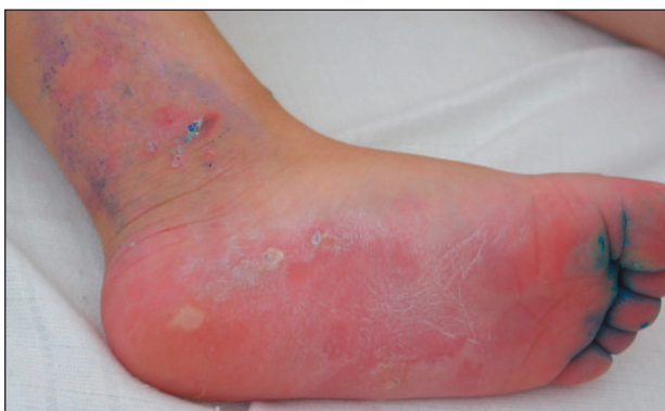
Obr. 2. SEB-Koebner: u 2letého chlapce se puchýře hojí bez jizvení.

V novorozeneckém věku je diagnostika EB obtížná, neboť příznaky u všech tří typů EBC se překrývají (2, 4, 6). U pacienta je vhodné sledovat vývoj klinických příznaků a teprve potom přistoupit k odebrání vzorku kůže k histologickému vyšetření. Některé typy EBC se v prů-