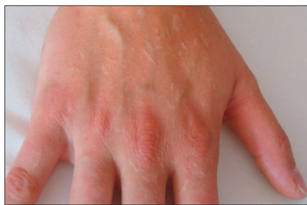
Obr. 4. SEB-Koebner: hypertrofické jizvy na hřbetech rukou matky 2letého pacienta.

běhu života lepší, např. EBS – Dowling Meara, jiné horší (DEB – Hallopeau Siemens). Rosah postižení se liší i v jedné rodině.