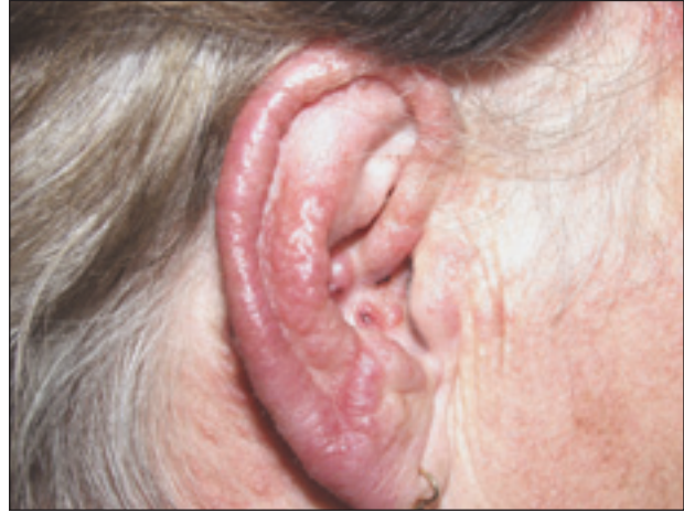
Obr. 2. Výsev papul vodnatého vzhledu na ušním boltci a přilehlém okolí.