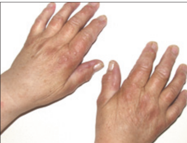
Obr. 3. Edematózní prosáknutí rukou s nálezem papul zejména v periartikulární lokalizaci.