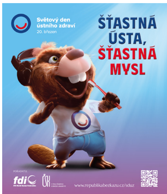
Světový den ústního zdraví 2025: připravovaný plakát pro děti (vlevo) a pro dospělé (vpravo).