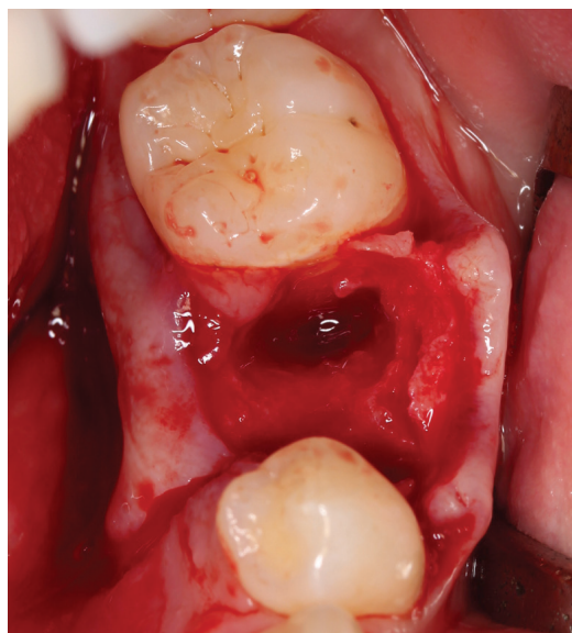
Obr. 1 Stav po extrakci zubu 75 a vybavení retinovaného premoláru 35.

Následující odborná sdělení jsou v rámci české odborné literatury o transplantacích zubů přelomová a ukazují dlouhodobé výsledky jak u autotransplantovaných zubů [12], tak u zubů alotransplantovaných [13]. U autotransplantovaných zubů se jednalo o soubor 138 zubů, z nichž většinu tvořily špičáky, dále premoláry a 17 molárů. Tento soubor byl sledován v rozmezí jednoho až sedmi let. Po sedmi letech bylo bez patologického nálezu pouze 27 zubů. U alotransplantovaných zubů se jednalo o soubor 90 zubů, které byly sledovány pouze po dobu dvou let po zákroku. Jednoznačně vyšší neúspěšnost byla spojena se zuby, u nichž se dárce a příjemce lišili ve více než dvou HLA antigenech. Dvojice autorů Komínek a Rozkovcová pak svoje publikované výsledky spolu s praktickými připomínkami a závěry shrnuli ve stati „Transplantace zubů“ otištěné ve sborníku Pokroky ve stomatologii [14]. Dalším z českých autorů věnujících se transplantacím zubů byl Vaněk, který v roce 1975 publikoval souhrnný článek o zubních transplantacích [15]. V roce 1981 pak byla