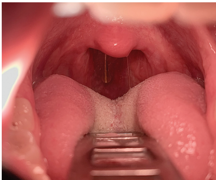
Fig. 2 Restech probe introduced to the level of the soft palate