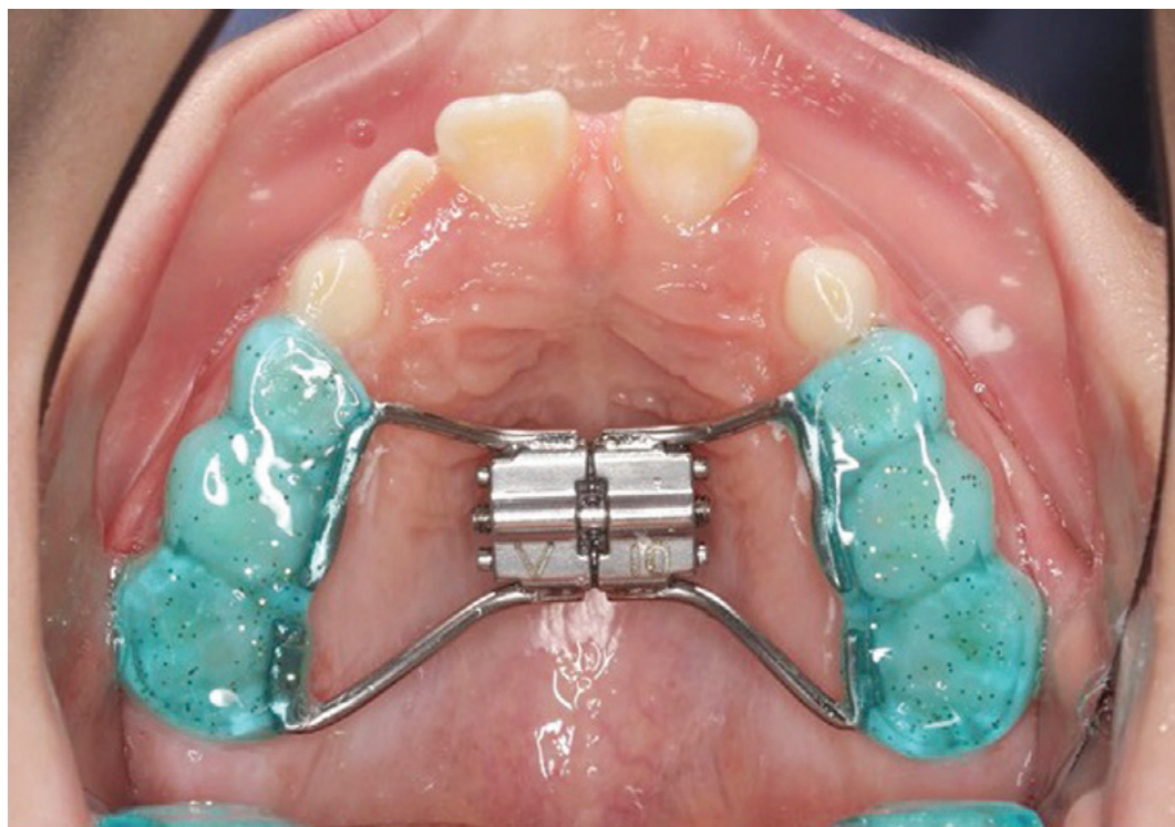
Obr. 1 Pryskyřičný aparát se šroubem