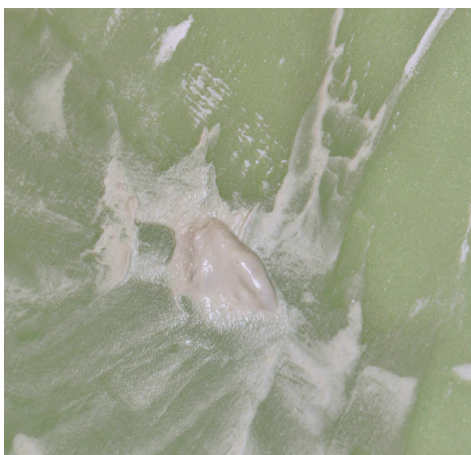
Obr. 1 Čerstvo namiešaný biokeramický kalciumsilikátový cement ProRoot® MTA

Prídavok látok, ako je napríklad oxid bizmutitý, síran bárnatý alebo oxid zirkoničitý, prepoži-