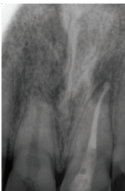
Fig. 4 Root canal obturated with bioceramic sealer BioRoot™ RCS and gutta-percha