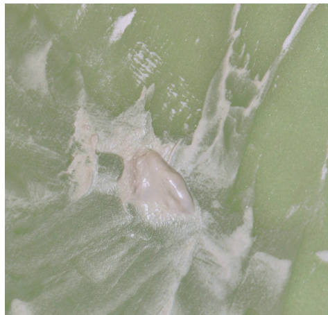
Obr. 1 Čerstvo namiešaný biokeramický kalciumsilikátový cement ProRoot® MTA

Prídavok látok, ako je napríklad oxid bizmutitý, síran bárnatý alebo oxid zirkoničitý, prepoži-