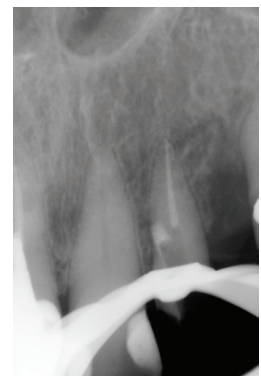
Fig. 2 Perforation repair by bioceramic material ProRoot® MTA