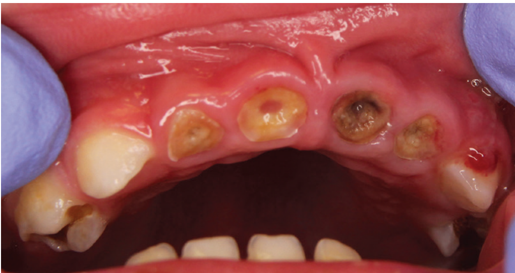
Obr. 3 Kariézní dočasný chrup dítěte ve věku 26 měsíců se zánětlivým postižením kosti alveolárního výběžku horní čelisti ve frontální krajině

Tato komplikace souvisí s poruchou příjmu potravy. V důsledku bolesti dítě buď odmítá příjem tuhé potravy vůbec, nebo sousta polyká nedostatečně rozžvýkaná. To může vést k trávicím obtížím až k neprospívání dítěte. V jiných případech dítě vyžaduje pouze měkkou či kašovitou stravu, což se nepříznivě projevuje na stavu chrupu a gingivy. Vážné samoočišťování, vznikají bolestivé záněty dásní a nechutí dítěte k tužší stravě se prohlubuje. Bylo prokázáno, že děti se zubním kazem v časném dětství jsou často pod třetím váhovým percentilem pro daný věk. Chronický zánět má vliv na metabolické procesy, cytokiny (IL 1 \alpha a IL 1 \beta ) mohou inhibovat erytropoezu [19, 20]. Nedostatečný energetický příjem může ovlivňovat produkci hormonů kůry nadledvin a následně růst dítěte [20].