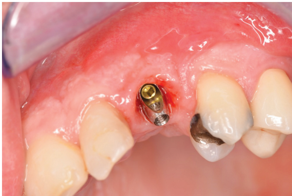
Obr. 3 Abutment pro tranzverzální šroubování in situ, okluzní pohled; nevýhodná osa manipulačního kanálu je převedena na orální stranu suprastrukury

Fig. 3 The abutment for transversely screw-retained crown, occlusal view; the screw access hole is on the oral surface of the crown