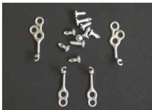
Obr. 1 Skeletální miniplaty typu Bollard s fixačními šrouby – sada určená pro jednoho pacienta

Vyšetření pacienta indikovaného k této terapii obsahuje nezbytný odběr detailní anamnézy, podrobné vstupní vyšetření jak ortodontistou, tak chirurgem s využitím Cone Beam CT (CBCT) vyšetření obličejového skeletu, včetně kloubních hlavic mandibuly, faciálního skenu a 3D skenu dentice, bočního kefalometrického snímku, ortopantomogramu, intraorální a extraorální fotodokumentace a studijních modelů, včetně jejich diagnostické přestavby modelů. Celý soubor vyšetření je indikován i po ukončení léčby [4, 5]. Po šesti měsících léčby je vhodné zopakovat kefalometrický snímek a studijní modely. Při každé ortodontické kontrole na