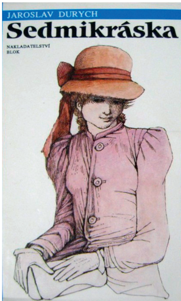
Obr. 7 Sedmikráska

O Durychovi bylo známo, že měl k řadě událostí první republiky kritický postoj, a tak byl v letech okupace lákán ke kolaborantské aktivitě. To však Durych rázně odmítl a stáhl se do soukromí. Nacismus byl pro něho „hnědé novopohanství zohýbaného kříže“. Konec světové války pak nepřinesl zlepšení jeho postavení. Durych cítí, že se ocitá v izolaci a dozvídá se i důvod – jsou to některé jeho statě, z nichž nekontroverznější byl článek Očista duší, v němž kritizoval představitele veřejného života Československé republiky. V tomto příspěvku nikoho nejmenoval, ale z některých jeho formulací, zejména kritiky realismu bylo čtenářům jasné, že se týkají prvního prezidenta státu. Zmíněný článek se stal v roce 1945 předmětem jednání komise, která došla k závěru, že i když byl Durych jiných názorů než TGM a i když s ním polemizoval od roku 1930, podzim a zima roku 1938 byla nevhodnou dobou k tomu, aby kritizoval