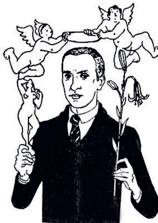
Obr. 3 Jaroslav Durych v kresbě V. H. Brunnera

Durychovy básnické pokusy pocházejí již z jeho studentských let a po nich následuje próza. Durych se pozvolna stává uznávaným spisovatelem. Když přijal pozvání navštívit přítele v Bělé pod Bezdězem,