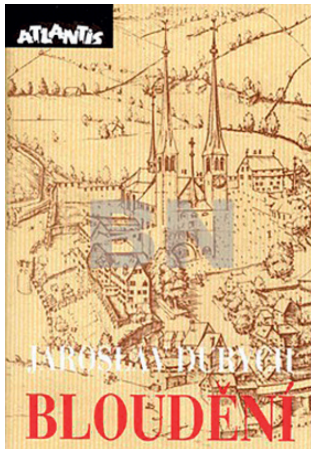
Obr. 4 Bloudění

Faktickou vládu tedy tvoří ústředí stran. Vládou tedy strany; sice vládne dnes strana s větším aparátem, druhá s menším,