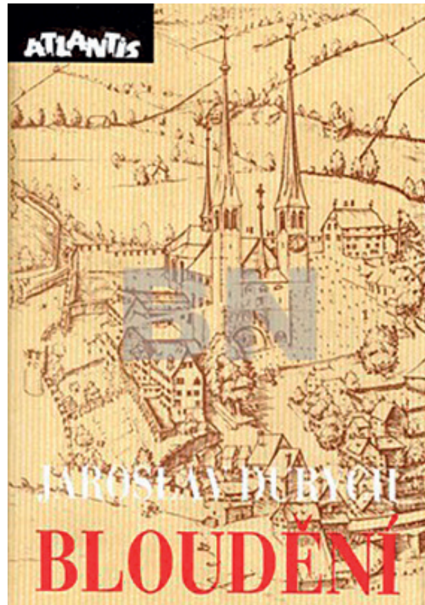
Obr. 4 Bloudění

Faktickou vládu tedy tvoří ústředí stran. Vládou tedy strany; sice vládne dnes strana s větším aparátem, druhá s menším,