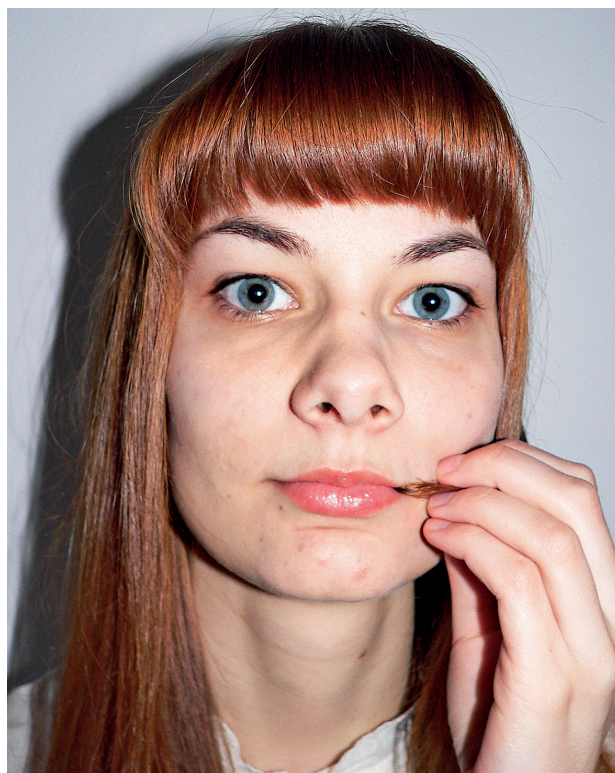
Obr. 6. Simulace zlozvyku pacientky (foto manekýny)

ČESKÁ STOMATOLOGIE ročník 118, 2018, 2, s. 33–38