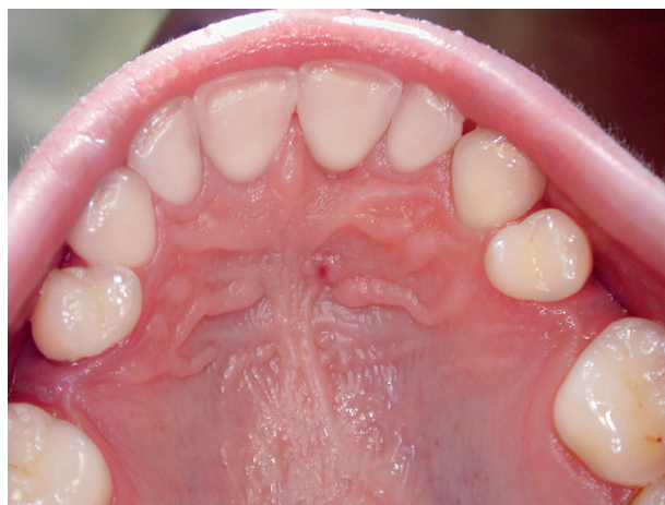
Obr. 3. Pohled na tvrdé patro s dobře patrným ústím slepě končícího kanálku v místě původní píštěle v době bezprostředně po ošetření

Vzhledem k narůstajícím subjektivním obtížím bylo provedeno v lokální anestezii šetrné subgingivální ošetření defektu s použitím mini-kyret Gracey určených k ošetření frontálních zubů (G1/2, G3/4). Během tohoto zákroku se ve směsi subgingiválního plaku (nikoli subgingiválního kamene) a krve objevilo velké, nepočitatelné množství dobře viditelných, 2–3 mm dlouhých, tmavých vláknitých částek neznámého cizorodého materiálu, připomínajících nejspíše drobné ústřížky či úlomky vlasů (obr. 2). Ošetření parodontálního chobotu bylo doplněno incizí palatinální prominence, z níž byla při exkochleaci jemnou lžičkou získána kapka hnisu a poté krev s mnoha dalšími částčkami stejného vláknitého materiálu, který byl zčásti fixován v 10% roztoku