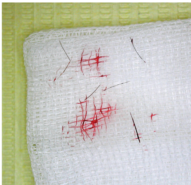
Obr. 2 Růžek gázového čtverce s několika částčkami tmavého cizorodého materiálu pocházejícího z parodontálního defektu (po osušení vlasových částek)

Klinický nález: Obličej symetrický, bez deformit a otoků. Regionální mízní uzliny nehmatné, palpčně nebolestivé, věku přiměřený nález na žvýkacích svalech, čelistním kloubu, velkých slinných žlázách. V ústní dutině byl nalezen nekompletní, sanovaný stálý chrup bez dolních třetích molárů a s mezerami v premolárových úsecích horního zubního oblouku. Frontální zuby měly výraznější, věku neúměrné abraze na incizních hranách, nezasahující do dentinu. Ústní hygiena byla velice dobrá. Gingiva v celém chrupu byla bez zánětlivých změn. Zubní kámen nebyl nalezen. Hodnoty CPI při stanovení modifikovaného CPITN (PSR, Periodontal Screening and Recording dle AAP) činily v horním zubním oblouku zprava doleva 0* 4* 0*, v dolním zubním oblouku 0 0* 0, tzn. gingivální recesy hlubší než tři milimetry byly nalezeny ve všech horních sextantech a v dolním frontálním sextantu (symbol *). Nebyla prokázána přítomnost parodontálních chobotů s výjimkou horního středního sextantu. Levostranný horní střední řezák byl pevný, funkční, vitální, poklepově nebolestivý, s abrazí na incizní hraně a vestibulárně lokalizovaným gingiválním recesem hloubky 1,5 mm (obr. 1a). Palatinálně byl nalezen parodontální chobot hloubky 9 mm, sondovatelný bez bolesti a hnisavé exsudace. Gingivální reces nebyl přítomen, tzn. ztráta úponu (loss of attachment) v tomto místě činila rovněž 9 mm. Na palatinální sliznici přibližně v úrovni hrotu kořene se nacházelo drobné, zarudlé vyklenutí elastické konzistence