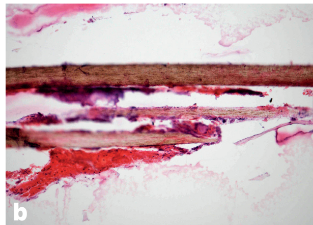
Obr. 4a, b. Histologický obraz lidského vlasu – přehledová mikrofotografie (x40, HE) (a), a detailní záběr téhož vlasu (x100, HE) (b).