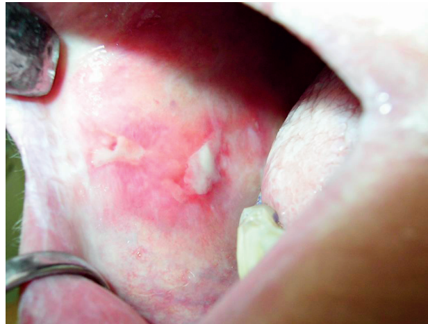
Obr. 4 Rozsiahla erozívno-bulózna forma na bukalnej sliznici (Đurovič)

PRAKTICKÉ ZUBNÍ LÉKAŘSTVÍ, ročník 66, 2018, 1, s. 3-7