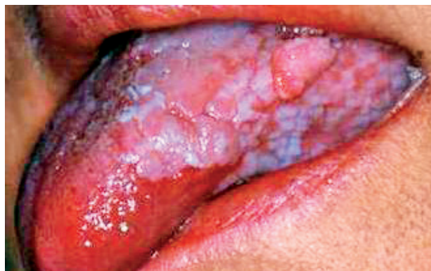
Obr. 5 Plak forma a atrofická forma s tvorbou verúk na bokoch jazyka (Ďurovič)

Nakoľko OLP má možnosť meniť svoj typ, kvantitatívne a kvalitatívne meniť svoju štruktúru, je po-