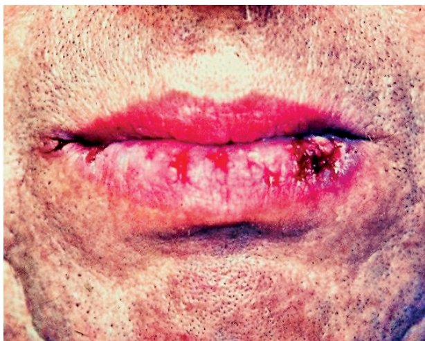
Obr. 3 Erozívny lichen na mukokutánnom spojení dolnej pery (Đurovič)

Ťažšia forma je erozívna alebo bulózna forma. Najčastejšie pozorujeme, že sa paralelne vyskytuje aj retikulárny typ. Pri vezikulárnych a bulózných eflorescenciách pozorujeme rozsiahle erózie, kryté