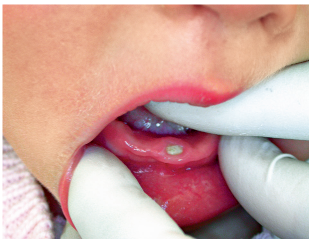
Obr. 3 Reziduální natální zub