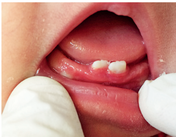
Obr. 1 Dva natální zuby v dolní čelisti u novorozence ve věku dva týdny

ČESKÁ STOMATOLOGIE ročník 117, 2017, 4, s. 85-89