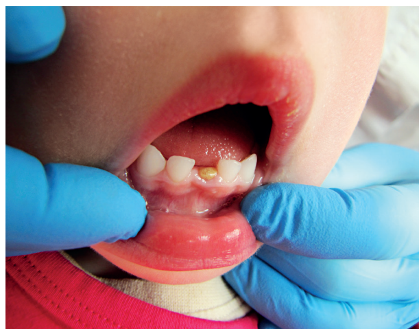
Obr. 4 Klinický nálezu u dítěte ve věku pět let a šest měsíců