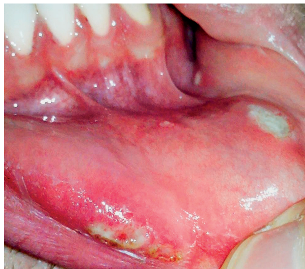
Obr. 4 Tvorba krústa na dolnej pere, na koži pery (Timková).