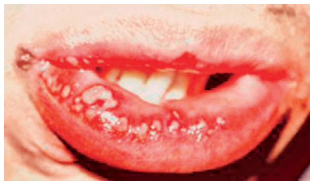
Obr. 3 Herpetické lézie na sliznici dolnej pery, sprevádzané demarkačným zápalom (Vodrážka).

V detskom veku sú prodrómy značne nápadné. Deti sú nevrle, podráždené, prípadne unavené a spavé. Často sa samé žiadajú do postieľok a strácajú záujem o hry s deťmi a dospelými. U starších detí pozorujeme subfebrility a rhinitídy. Prodromálne štádium trvá krátko, asi jeden deň, a nastupuje proces progrediencie procesu. Pri perakútnom priebehu