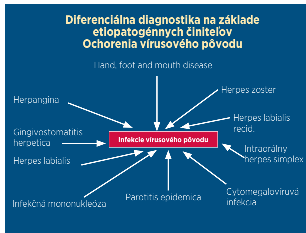
Schéma 1 Diferenciálna diagnostika nozologických jednotiek gingivostomatitis acuta

PRAKTICKÉ ZUBNÍ LÉKAŘSTVÍ, ročník 65, 2017, 3, s. 35-39