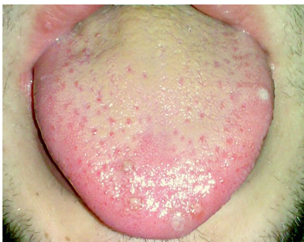
Obr. 7 Rozsiahly enantém na tvrdom podnebí. Na dolnej pere sú prítomné vezikulárne eflorescencie (Tímková).