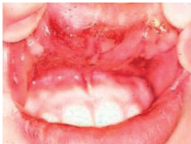
Obr. 2 Herpetické lézie na sliznici hornej pery. Prítomná je sprievodná cheilitis. Na mukokutánnom spojení je prítomná krustácia (Ďurovič).

Ak berieme do úvahy, že stomatologickú odbornú verejnosť sme o sekundárnych infekciách v minulosti informovali, ostáva nám pojednať v prehľade o súčasných poznatkoch o gingivostomatitis herpeticus (ďalej len g.s.h). Pharyngitis herpeticus je doménou ORL a keratoconjunctivitis herpeticus ophthalmológie.