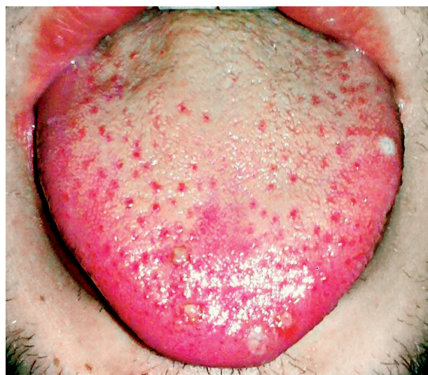
Obr. 6 Intenzívny povlak jazyka, v jeho strede je zápal filiformných papíl, čo vytvára vzhľad malinového jazyka (Tímková).