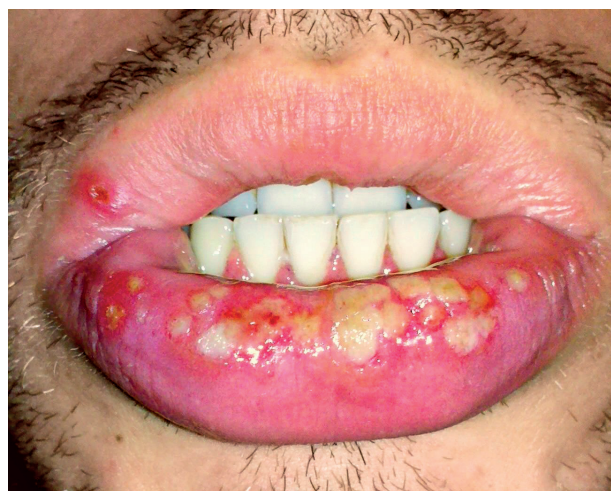
Obr. 8 Tvorba vezikulárnych eflorescencií a ich macerácia. V strednom úseku herpetické erózie splývajú (Tímková).

PRAKTICKÉ ZUBNÍ LÉKAŘSTVÍ, ročník 65, 2017, 3, s. 35–39