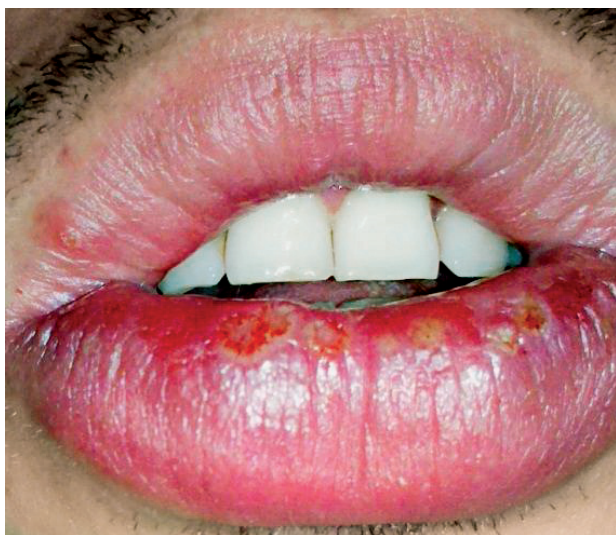
Obr. 5 Herpetické lézie na sliznici dolnej pery a v prechodnej riae (Tímková).