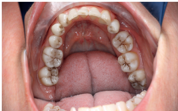
Obr. 1 Klinické vyšetření bez vizuální detekce zubního kazu

Pokud je sklovina narušena demineralizačním procesem, procházející fotony světla jsou rozptýle-