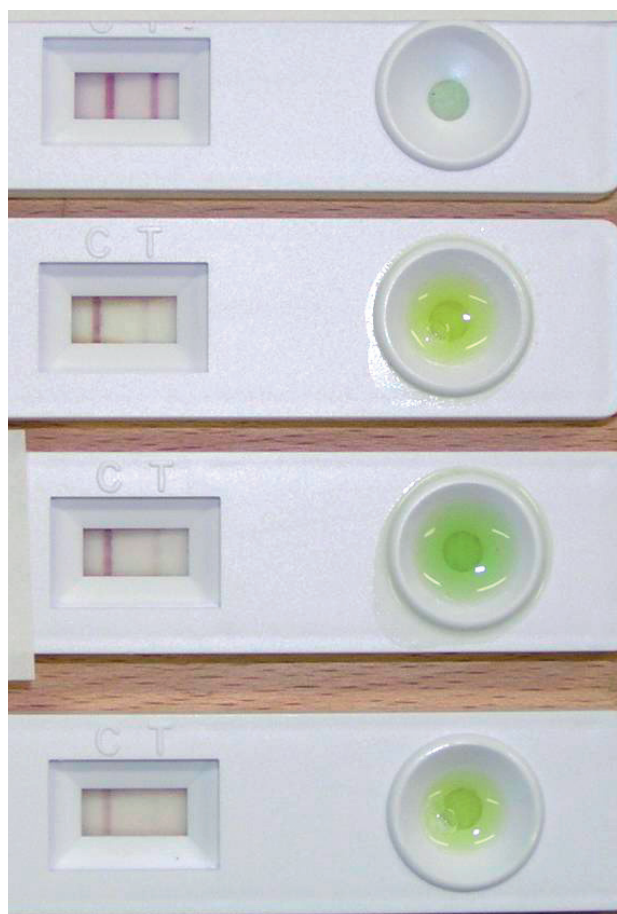
Obr. 4 Srovnání výsledků několika postupně hodnocených testů Saliva-check mutant u jednoho pacienta