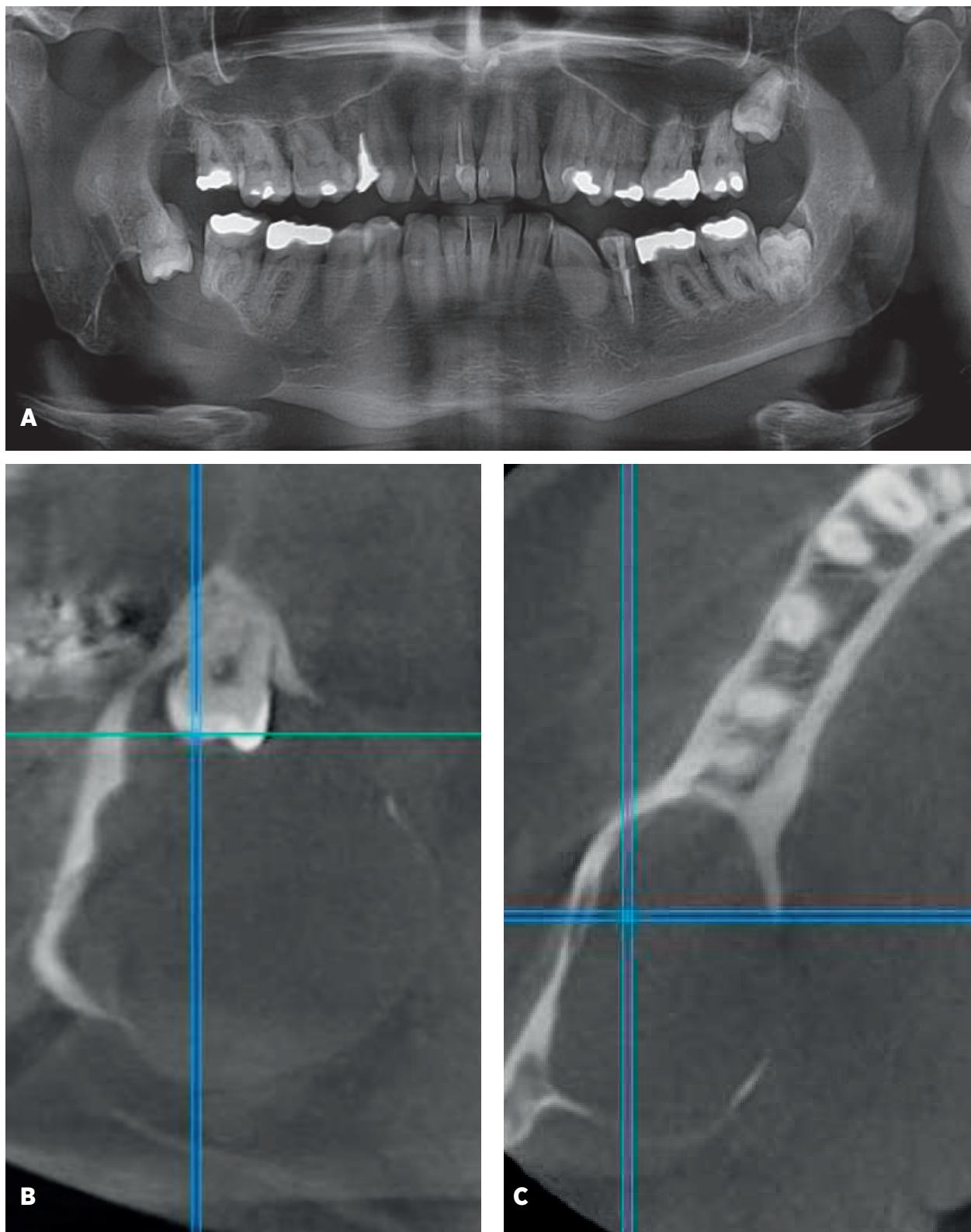
Obr. 1 Ortopantomogram s nálezem rozsáhlé folikulární cysty v místě zubu 48 (a). Jednalo se o náhodný nález při preventivní prohlídce u praktického zubního lékaře. CBCT bylo provedeno na klinickém pracovišti (b, c).

PRAKTICKÉ ZUBNÍ LÉKÁŘSTVÍ, ročník 64, 2016, 2, s. 25-32