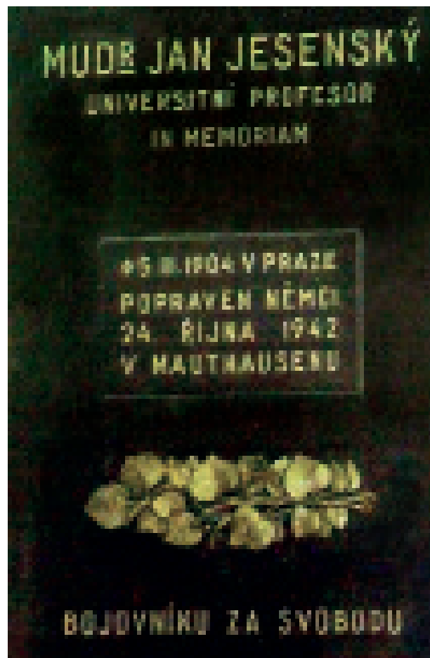
Obr. 3 Pamětní deska v knihovně Stomatologické kliniky v Kateřinské ulici v Praze