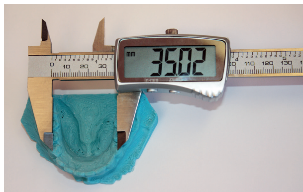
Obr. 3 Měření digitálním posuvným měřítkem na modelu získaném 3D tiskem

Měření prováděla dvakrát stejná osoba v intervalu jednoho týdne. Bylo použito digitální posuvné měřítko Festa (Čína) s přesností 0,01 mm (obr. 3). Celkem bylo získáno 120 údajů, které byly statisticky analyzovány.