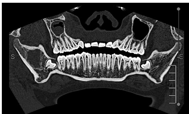
Obr. 1 Na CT snímku (převedený do OPG zobrazení) patrná rozsáhlá cysta pravé větve mandibuly za zárodkem zubu 48