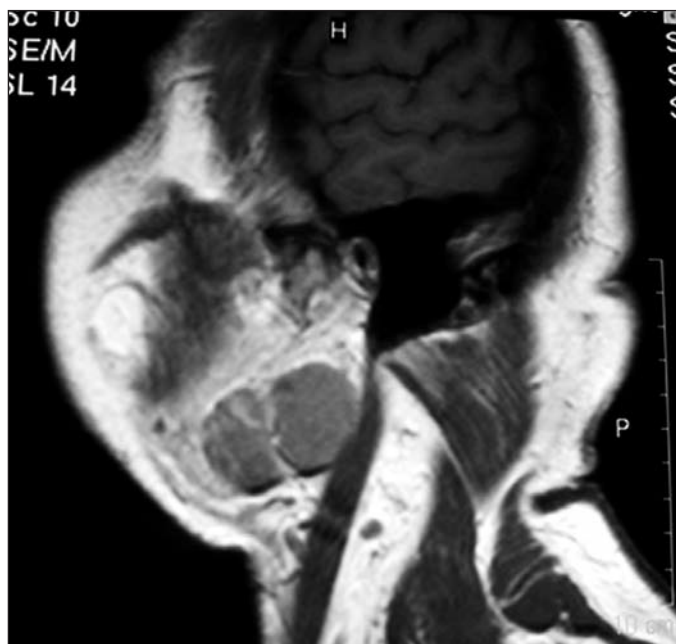
Obr. 2 Ohraničené nádorové uzly v dolním pólu levé příušní žlázy (MR)

Exstirpaci tumoru jsme provedli v březnu 2004. V celkové anestezii jsme vedli kožní řez tvaru protáhlého písmene S od levého tragu směrem pod čelistní úhel a do submandibulárního trigona. Šetrnou preparací jsme postupně pronikli k pouzdru nádoru, při čemž jsme identifikovali a chránili n. VII. Nádor byl tvořen dvěma opouzdřenými uzly velikosti holubího vejce. Jeho ventrální partie byly pevně fixovány ke strukturám po-