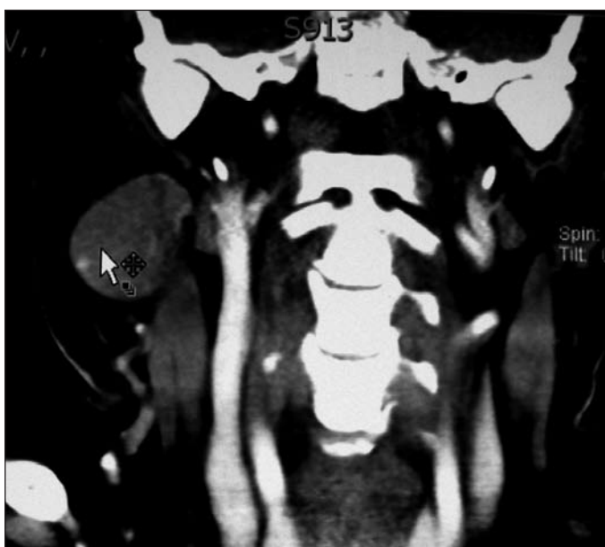
Obr. 4 CT vyšetření s intravazálním kontrastem prokázalo tumor velikosti švestky pod pravým čelistním úhlem