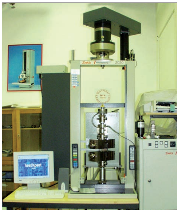
Obr. 2 Zkušební stroj ZWICK Z020 typ OK – 6423; snímač síly: 2,5 kN, rychlost tahu: 2 mm/min