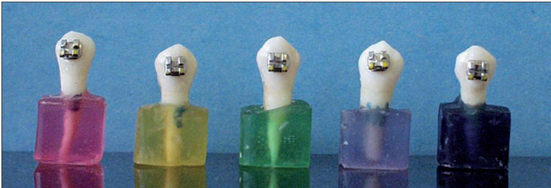
Obr. 1 Barevné rozlišení skupin vzorků zalitých v pryskyřičných bločcích