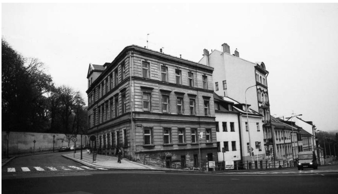
Obr. 4 Dům na křižovatce mezi ulicemi Viničná a Benátská, první sídlo zubní kliniky

V archivu stavebního odboru v městské části Prahy 2 je uložen projekt stavby muzea, na němž nacházíme podpis profesora Jesenského jako stavebníka vedle jména architekta Jaromíra Krejcara. Budova na plánu je označena jako „Pavillon pro sbírky“, slovo muzeum tam nevidíme. Je to příznačné pro generaci avantgardních architektů funkcio-