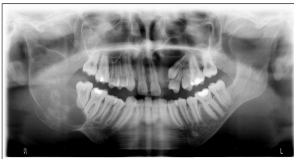
Obr. 1 Na OPG snímku patrná rozsáhlá cysta pravé větve mandibuly a folikulární cysta loco 23

Je důležité připomenout, že ne všechny cysty vznikají stejně [5]. Totéž platí pro mechanismus jejich růstu. Např. folikulární cysta se rozvíjí tak, že během obtížné erupce zubu dojde k poranění perikoronárního vaku a mezi ním a zubem se začne hromadit tekutina. Následný růst již probíhá na základě osmotického tlaku, jak je popsáno výše. Není tedy zánětlivého původu, ale je cystou vývojovou [20]. Nejčastěji jsou tímto procesem postiženy třetí moláry dolní čelisti [4]. Svým chováním je specifická odontogenní keratocysta, která se, jak je již výše uvedeno, zakládá ze zbytků dentální lišty [6]. Cystická dutina je vystlána membránou s orto- či parakeratózou, kde dochází k aktivní proliferaci. Cysta tedy neroste pasivně na základě osmotického tlaku, nýbrž aktivní proliferací buněk. Toto také vede některé autory k závěru, že tato cysta je benigní neoplazií. To se také promítá v přístupu k léčbě odontogenních keratocyst, která musí být více radikální. Některé cysty, ač se vyskytují v čelistech, nemusí mít vývojově vůbec žádný vztah k zubům (neodontogenní cysty). Nejčastější cystou tohoto druhu je cysta ductus nasopalatini [2].