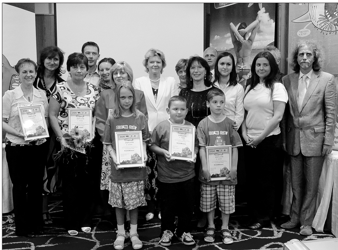
Obr. 1 Ze soutěže

Význam a opodstatnění soutěže – přivést do stomatologických ordinací co nejvíce školních dětí k preventivním prohlídkám – potvrdilo i první hodnocení programu po 4 letech realizace na základních školách.