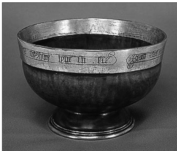
Obr. 1 Nádoba Mazer z javorového dreva s obrubami z pozláteného striebra, pochádzajúca z roku 1380 [12]