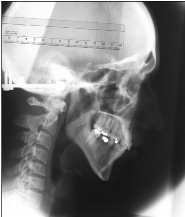
Obr. 1. Telerentgenogram, včetně jeho kalibrace před počítačovou úpravou.