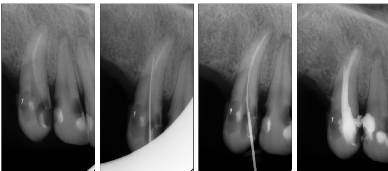
Obr. 3a. Reendodoncie zubu 13.