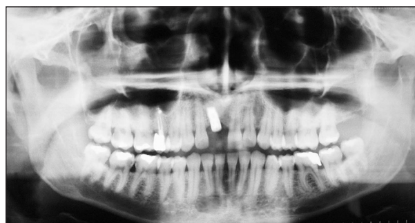
Obr. 6. Stav po zavedení dentálního implantátu SIN, stín sytosti kovu zobrazuje vlastní implantát.