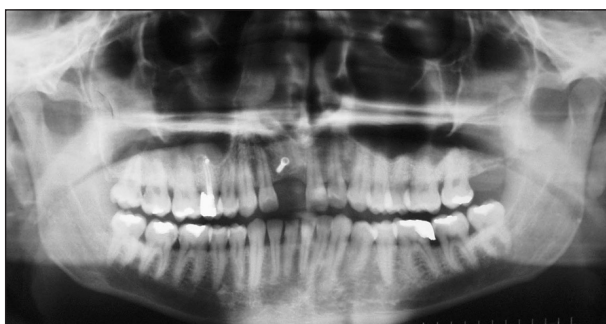
Obr. 5. Stav 4 měsíce po augmentaci, rentgenogram zobrazuje uspokojivý efekt, zejména v blízkosti zubu 21. Stín sytosti kovu v zájmové oblasti odpovídá tvarem fixačnímu šroubku.