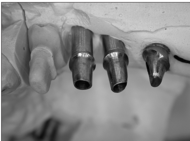
Obr. 2. Pracovní model se třemi upravenými abutmenty na replikách implantátů.

V literatuře je popsáno jen velmi málo o srovnání způsobů upevnění náhrady na implantáty. Přehledný referát posuzující některé výhody