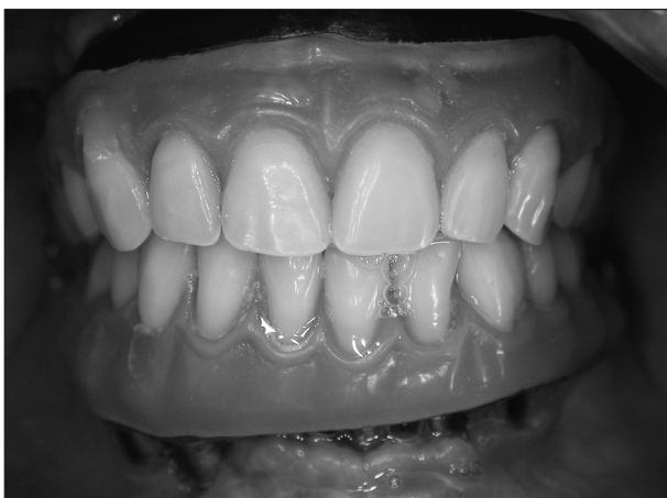
Obr. 10. Výlučně šroubované suprastruktury u značně pokročilé atrofie alveolárních výběžků.

Z praktického hlediska je vhodný tento způsob připevnění u jednotlivých korunkových náhrad a krátkých můstků. V případě ošetření bezzubé čelisti s větším počtem implantátů je vhodný pouze tehdy, není-li příliš velká divergence implantátů a dále pokud není nutno nahrazovat chybějící část alveolárního výběžku (růžová keramika nebo plast (obr. 10). Faktem je, že abutmenty pro cementaci musí mít zachovanou určitou výšku a sklon stěn podobně jako při preparaci zubních pilířů, aby nedošlo k uvolnění náhrady při funkci. Proto je suprastruktura celkově objemnější a zabírá více místa zejména na orální straně v porovnání s náhradou šroubovanou.