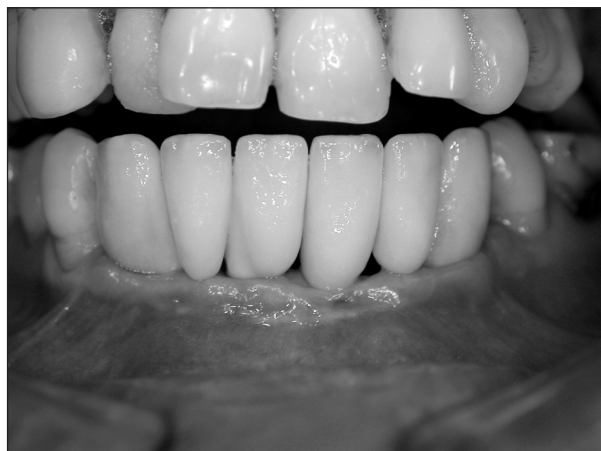
Obr. 6. Metalokeramický můstek přímo připojený k implantátům v místě 33, 31, 41 a 43.

V současné době se stále více uplatňuje přímé napojení náhrady na implantáty bez abutmentů, a to v široké škále indikací (korunkové náhrady, krátké můstky, úplné náhrady chrupu). Šroubo-