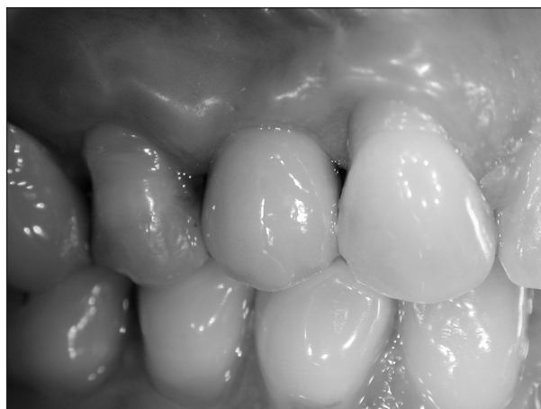
Obr. 9. Metalokeramická korunka 14 po cementování na abutment.

Výroba cementované náhrady je v porovnání