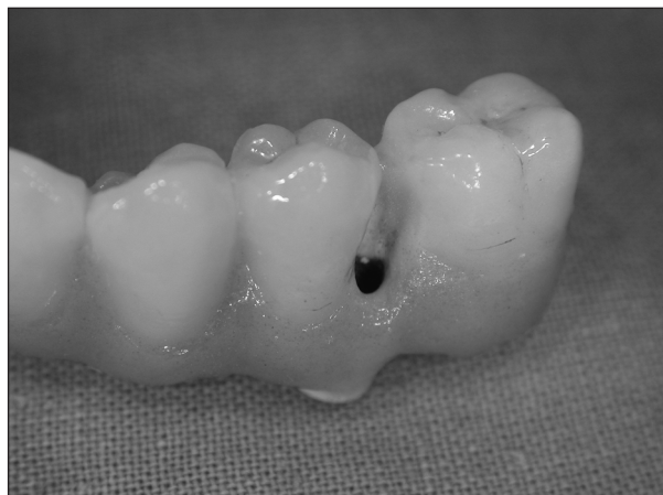
Obr. 8. Vstupní otvor pro fixační šroubek umístěný vestibulárně mezi 35 a 36.

vanou suprastrukturu je možno v budoucnu kdykoli sejmout a opětovně připojit (obr. 6, obr. 7).