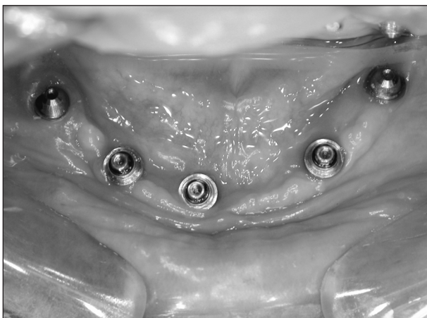
Obr.4. Abutmenty pro šroubovanou suprastrukturu připojené k pěti implantátům v bezzubé dolní čelisti.