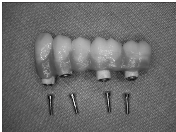
Obr. 1. Šroubovaná suprastruktura pro přímé spojení s implantáty.

Jednou z nich je i způsob připevnění fixní zubní náhrady k implantátům. Korunkové a můstkové náhrady chrupu mohou být k implantátům připojeny přímo – fixace velkým šroubkem (obr. 1) anebo nepřímo prostřednictvím abutmentů (cementace (obr. 2, obr. 3) nebo fixace malým šroubkem (obr. 4, obr. 5). Abutmenty jsou továrně vyráběné prefabrikáty a představují jakýsi spojovací díl mezi implantátem a náhradou (protetický pilíř).