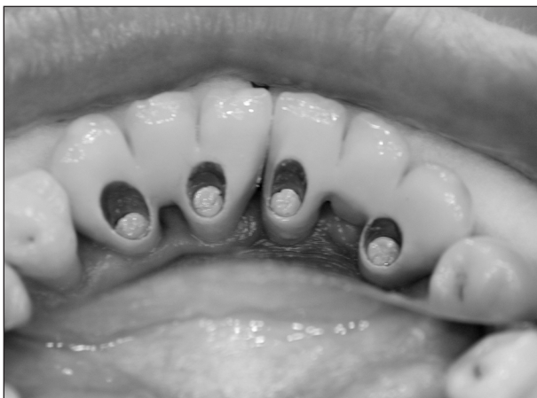
Obr. 7. Vstupy pro velké šroubky jsou z orální strany a uzavírají se gutaperčou a kompozitní pryskyřicí.