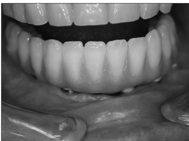
Obr. 12. Můstek z obr. 11 při prohlídce – obnažení „růžové“ části a abutmentů.