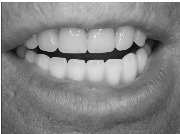
Obr. 11. Metalokeramický můstek v bezzubé dolní čelisti – obnažení „bílé“ části při úsměvu.