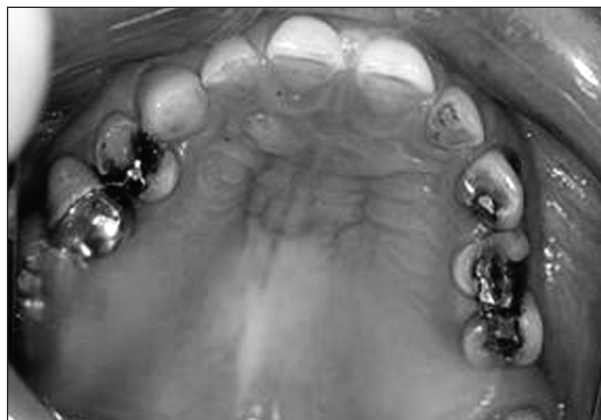
Obr. 5. Amalgám vystupující vlivem erozí nad zubní tkáň.