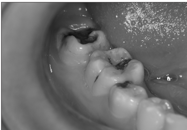
Obr. 3. Erozi způsobená sekundární pigmentace.