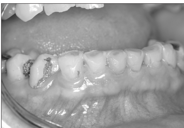
Obr. 4. Ztráta okluzních vrstev zubu.