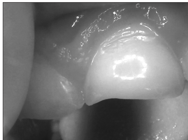
Obr. 1. Eroze postižená palatinální plocha zubu.

Nebezpečná je ztráta okluzních vrstev, kde může dojít k poruchám vertikálního vztahu čelistí, snížení skusu a následným změnám v temporomandibulárním kloubu (obr. 4). Amalgámové výplně jsou, na rozdíl od tvrdých zubních tkání, vůči erozím odolné. Proto v důsledku ztráty retenčních mechanismů vystupují nad zubní tkáně a působí jako by do zubů ani nepatřily, v angl. literatuře tzv. „stand above amalgam“ [1] (obr. 5). V okolí kompozitních výplní se objevují perkolorace a porušení okrajového uzávěru (obr. 6). Pozdní rozpoznání erozí a následné ztráty tkání mohou vést k časově i finančně náročným endodontickým a protetickým řešením [4].