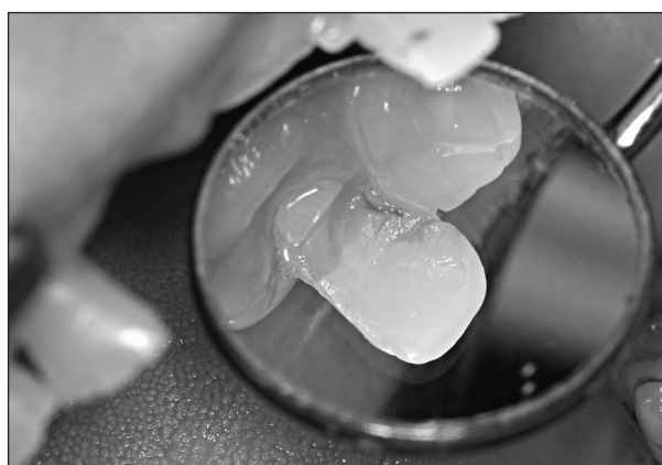
Obr. 6. Objevující se perkolorace a porušený okrajový uzávěr.