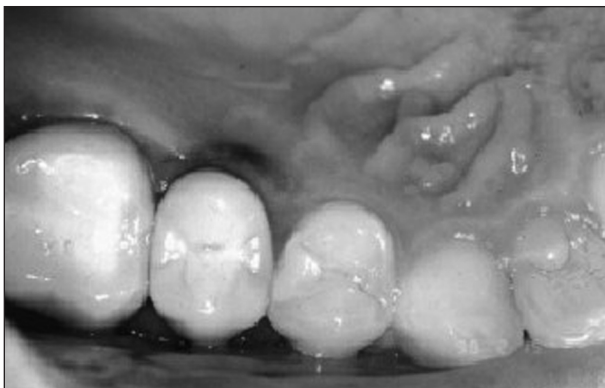
Obr. 1. Pigmentace tkáně.

Tmavě zbarvené oblasti sliznic (pigmentace) se skládají, jak vyplývá z analýz [1-3], především z částic obsahujících stříbro. Vznik pigmentace je v literatuře vysvětlován „zasekáním“ částic kovů, které se uvolnily při mechanickém opracování kovového materiálu v ústech [2-4]. Vzhled některých pigmentací (např. zbarvení charakteru pásu – obr. 1) však není možné na základě takového mechanismu vysvětlit. Obtížné je vysvětlení i tehdy, jestliže se zbarvení vytvoří relativně dlouho po aplikaci protetické práce. Tyto skutečnosti naznačují možnosti existence jiného mechanismu tvorby pigmentací.