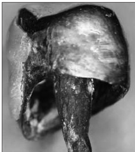
Obr. 2. Koroze kořenového čepu.

Na základě zdravotní dokumentace pacientů s tímto problémem bylo konstatováno, že kořenové nástavby zubu, v jejichž okolí byla sliznice tmavě zbarvena, byly vytvořeny z materiálů obsahujících významně stříbro (slitina Koldan, amalgámy). Analýzou stavu extrahovaných zubů s korunkami bylo zjištěno, že v průběhu expozice se vytvářejí mezi korunkou a tvrdou zubní tkání štěrbin, do kterých má přístup ústní prostředí. To se dostává do kontaktu s materiálem kořenové nástavby a jsou vytvořeny podmínky pro korozi (obr. 2.). Korozní produkty transportované do měkké tkáně mohou být základem tvorby pigmentací.