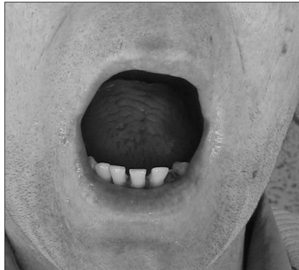
Obr. 7. Rozsah otvírání úst za dva týdny po operaci.