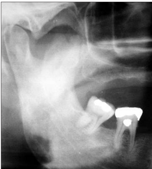
Obr. 3. Stín promítající se do oblasti muskulárního výběžku vpravo.

původ potíží. Pro tuto hypotézu svědčilo tuhé zduření v oblasti infra a praeaurikulárně vpravo a průkaz paketu osteoidní tkáně na MRI, odporovala jí však absence zvýšených teplot, normální hodnoty FW, CRP, AP a zvýšené množství leukocytů. Na ortopantomogramu (obr. 3) byl patrný