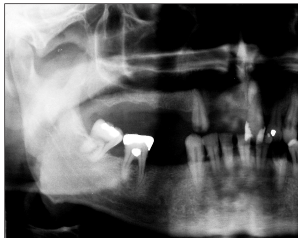
Obr. 8. Výřez z RTG snímku (OPG), stav po snesení osteoidní tkáně.

účelem prevence recidivy onemocnění, a tím udržení výsledku náročného operačního výkonu.