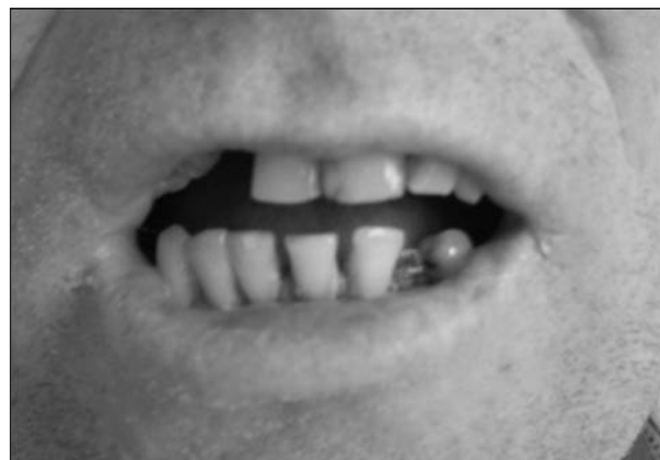
Obr. 1. Čelistní kontraktura.

vé chirurgie LF UP a FN v Olomouci se na doporučení otorinolaryngologa dostavil 41letý muž s asi tři měsíce trvajícím, extrémně omezeným otevíráním úst (obr. 1) a neostře ohraničeným zduřením, deformujícím pravou tvář (obr. 2). Rozsah abdukce mezi řezacími hranami frontálních zubů při aktivním i pasivním otvírání úst nepřesáhl 5 mm. Na pracovišti ORL bylo vyjádřeno podezření na zánětlivý nebo neoplastický