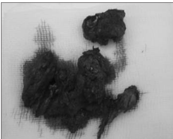
Obr. 6. Operační preparát.

vé nasotracheální anestezii (intubace za pomoci flexibilního bronchoskopu) a v antibiotické cloně (Dalacin) jsme kombinovaným extraorálním (subangulárním a praeaurikulárním řez) a intraorálním (slizniční řez v pravé horní ústní předsíni) přístupem pronikli k osteoidním masám, pevně nasedajícím na zevní plochu větve mandibuly a koronoidní výběžek. Po snesení těchto hmot (obr. 6) jsme remodelovali tvar větve mandibuly a resekovali muskulární výběžek ve výši semilunární incisury. Rozsah pasivní abdukce mezi řezáky v závěru operace byl 45 mm. Operaci jsme zakončili zavedením aktivního sání a suturou měkkých tkání. Pooperační průběh byl hladký, bez komplikací. Jeho prioritou byla účinná a pečlivá aktivní i pasivní rehabilitace otvírání úst za