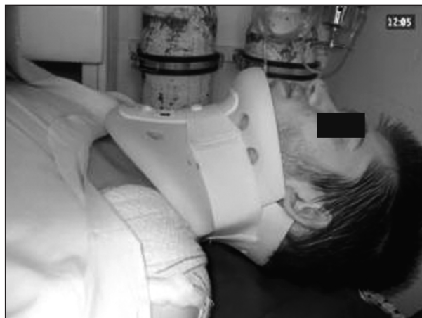
Obr. 3. Pacient s univerzálnym typom goliera (s podporou brady).

Glissonovou slučkou a následné vyhotovenie sádrového korzetu u sediaceho pacienta (napr. typ Minerva), alebo trakcie Crutchfieldovou svorkou, prípadne halo systémom u ležiaceho pacienta. Z otvorených chirurgických metód sa využíva spondylodéza, napr. platňou, kostným transplantátom alebo serklážou, niekedy aj predná laminektómia na dekompresiu miechy.