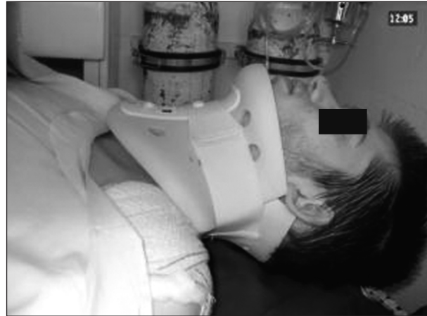
Obr. 3. Pacient s univerzálnym typom goliera (s podporou brady).

Glissonovou slučkou a následné vyhotovenie sádrového korzetu u sediaceho pacienta (napr. typ Minerva), alebo trakcie Crutchfieldovou svorkou, prípadne halo systémom u ležiaceho pacienta. Z otvorených chirurgických metód sa využíva spondylodéza, napr. platňou, kostným transplantátom alebo serklážou, niekedy aj predná laminektómia na dekompresiu miechy.