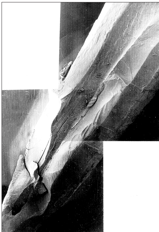
Obr. 1. Výskyt mikroskopických apikálních ramifikací i přítomnost pulpoperiodontálních anastomóz v apikální části kořenového kanálku. Zvětšení: 45x.

Při vyšetření v TEM jsme se zaměřili na vzhled stěny kořenového kanálku. Ústí dentinových tubulů bylo překryto vrstvou kolagenních vláken a jemně elektrondensní hmotou tvořnou patrně drobnými částicemi nekrotické tkáně (obr. 3). Kolagenní vlákna byla zatlačena i do dentinových tubulů, které v mnoha případech zcela ucpávala (obr. 4). Místy se však v tubulech vyskytovaly i různě veliké oblasti