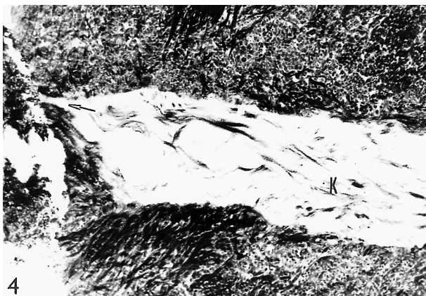
Obr. 4. Povrchová vrstva smear layer při větším zvětšení, uzávěr dentinového tubulu není úplný (šipka), kolagenní vlákna uvnitř tubulu (K) netvoří hermetický uzávěr. Zvětšení: 18000x.

Fig. 3. The surface layer of the smear layer (arrow) closing the entry into the dentine tubule. There is a small amount of collagen fibers (K) inside the tubule. Magnification: 6300x.