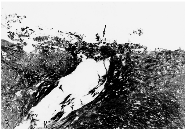
Obr. 3. Povrchová vrstva smear layer (šipka) uzavírající vstup do dentinového tubulu. Uvnitř tubulu jen malé množství kolagenních vláken (K). Zvětšení: 6300x.

Fig. 3. The surface layer of the smear layer (arrow) closing the entry into the dentine tubule. There is a small amount of collagen fibers (K) inside the tubule. Magnification: 6300x.