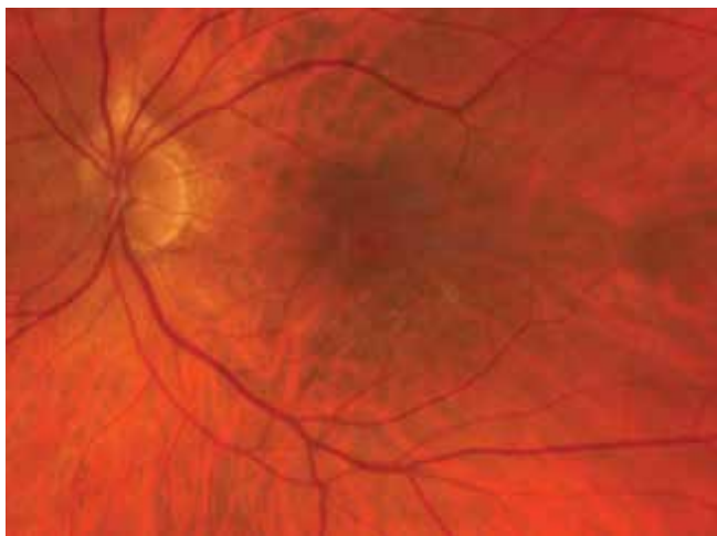
Obrázek 1. Fotografie makulární díry (Zeiss Clarus 700)

Cílem naší práce je porovnání funkčních a anatomických výsledků mezi technikou invertovaného laloku ILM a konvenčním odstraněním ILM u idiopatických makulárních děr na našem pracovišti.