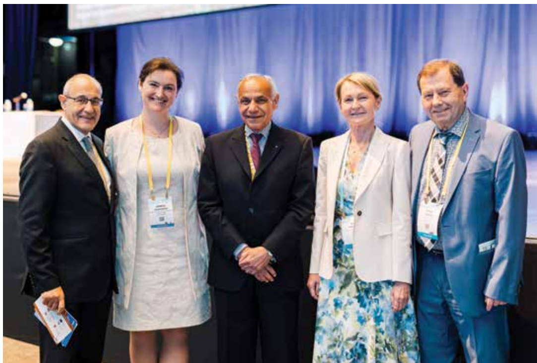
Obr. 1. Vedení SOE a ČOS