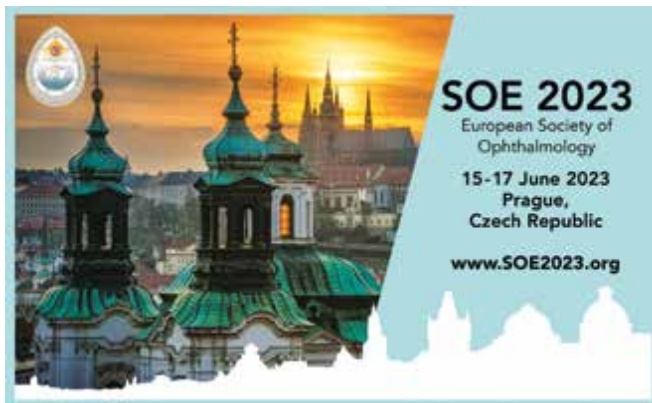
Obr. 2. Logo sjezdu