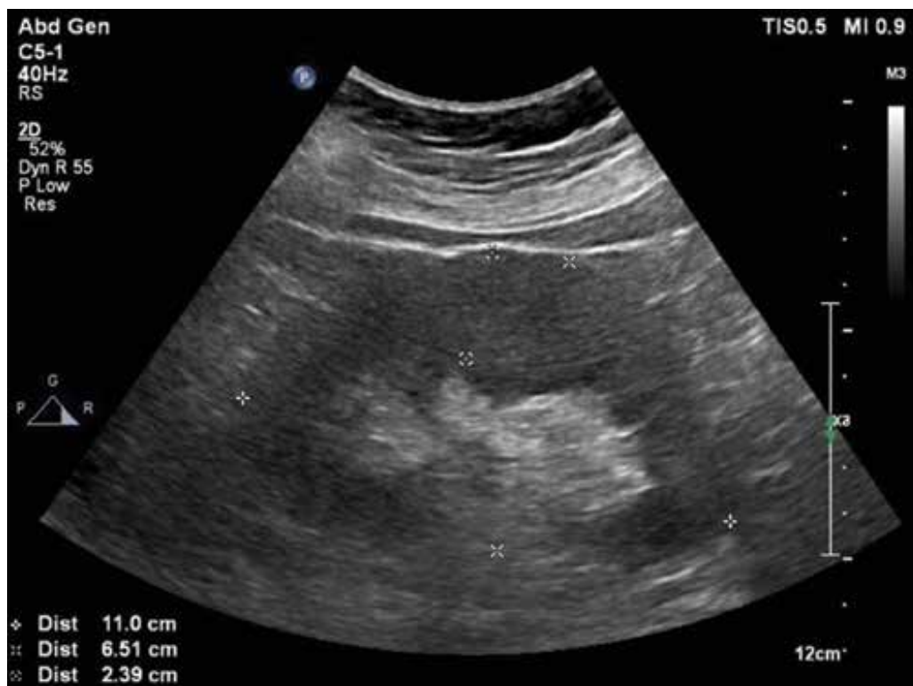
Obrázek 1. UZ ledvin – ledviny na hranici nefromegalie, parenchym 24 mm bilat.