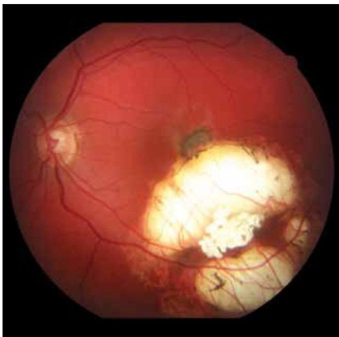
Obrázok 2. Funduskopický nálež na ľavom oku. Na okraji jazvy v makule nasadajúca subretinálna neovaskularizácia (2019)

So zvyšujúcim sa trendom používania anti-VEGF aj u mladších pacientov, stále ostáva otázná bezpečnosť a dlhodobé výsledky tejto terapie u detí a dospievajúcich. VEGF (vascular endothelial growth factor) má dôležitú úlohu pri normálnej angiogéneze, regulácii priepustnosti ciev a pri udržiavaní hematoencefalickej a hemoretinálnej bariéry. Dlhodobé účinky inhibície týchto funkcií, použitím anti-VEGF látok u detí je preto naďalej nutné sledovať aby sme sa mohli spoľahnúť, že ich použitie je úplne bezpečné. Zdá sa, že na stabilizáciu CNV u detí je potrebných menej injekcií anti-VEGF látok v porovnaní s dospelými. Dôvodom môže byť lepší funkčný stav retinálneho pigmentového epitelu