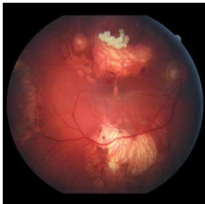
Obrázok 1. Fundoskopický nálež na pravom oku. Početné jazvy a koraliformné depozity po zhojených tumoroch a fibrózny pruh prechádzajúci cez makulárnu oblasť (2019)

V auguste 2019 bola najlepšia korigovaná zraková ostrosť (NKZO) na pravom oku 5/30 a na ľavom oku 5/15. V lokálnom fundoskopickom náleze dominovali na oboch očiach po zhojených tumoroch početné jazvy a koraliformné depozity, vpravo prechádzal vertikálne stredom makuly fibrózny pruh (Obrázok 1) a vľavo na okraji jazvy susediacej s makulou nasadala choroidálna neovaskulárna membrána (CNV) veľkosti 1/3 x 1 PD (Obrázok 2), ktorú sme potvrdili aj pomocou OCT (optická koherentná tomografia). Realizovali sme aj fluoroangiografické vyšetrenie (FAG) kde vľavo v mieste CNV sme zaznamenali presakovanie v neskorších fázach (Obrázok 3). Následne sme sa do ľavého oka rozhodli aplikovať intravitreálne bloká-