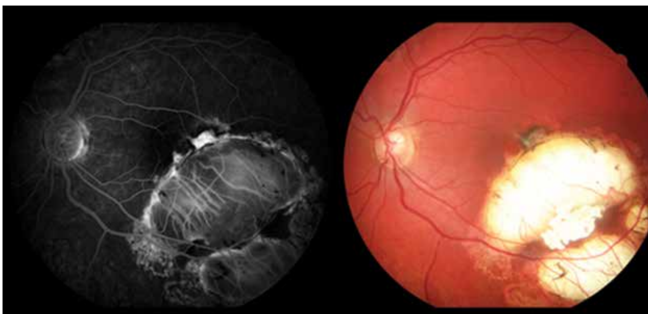
Obrázok 5. Kontrolné fluoroangiografické vyšetrenie a fotografia očného pozadia (2020)