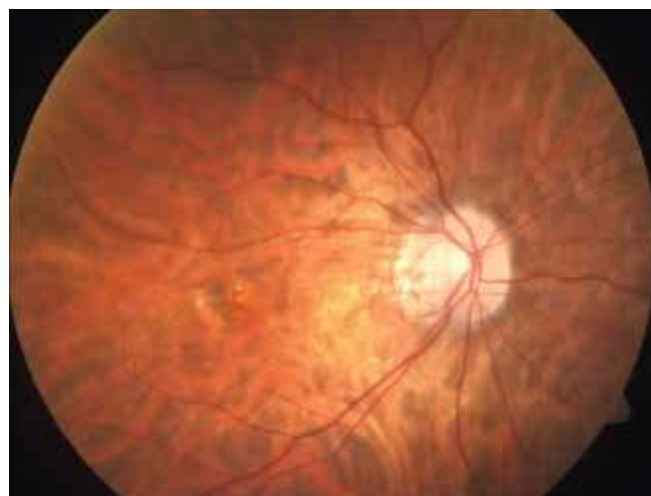
Obrázek 1. Fotografie sítnice pravého oka. Patrná pigmentovaná myopická choroidální neovaskulární membrána s drobnou hemoragií

Na kontrole v únoru 2020 byla NKZO stabilní, došlo ovšem k mírnému nárůstu edému a hyperreflektivního ložiska v makule, CRT byla 329 \mu m (Obrázek 2B). Po domluvě s pacientkou a ošetřujícím gynekologem byla indikována aplikace ranibizumabu do OP. Vzhledem k přítomnosti aktivní CNV v makule bylo také doporučeno vedení porodu císařským řezem (SC) pro riziko krvácení v makule při porodu vedeném přirozenou cestou. Před aplikací byla pacientka poučena o všech rizicích spojených s intravitreální aplikací ranibizumabu pro ni samotnou i pro plod. Pacientka tato rizika akceptovala a podepsala informovaný souhlas s intravitreální aplikací ranibizumabu. Aplikace proběhla ve 36. gestačním týdnu ve standardním režimu naší kliniky bez komplikací.