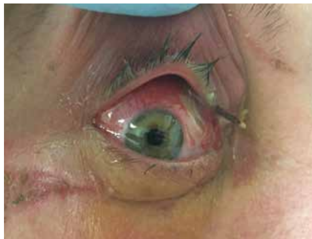
Obrázek 4-a. Pacientka s cizím tělesem v očníci. Příčinou byl pád v lese, oční bulvu byl nepoškozen

Penetrující poranění očníce rozdělujeme anatomicky podle lokalizace vstupní rány. Podle toho lze i predikovat, které struktury očníce mohou být poškozeny [16]. Penetrující poranění jsou buď s cizím tělesem nebo bez jeho přítomnosti v očníci.