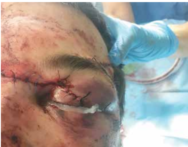
Obrázek 5-b. Stav bezprostředně po rekonstrukci víčka oftalmologem