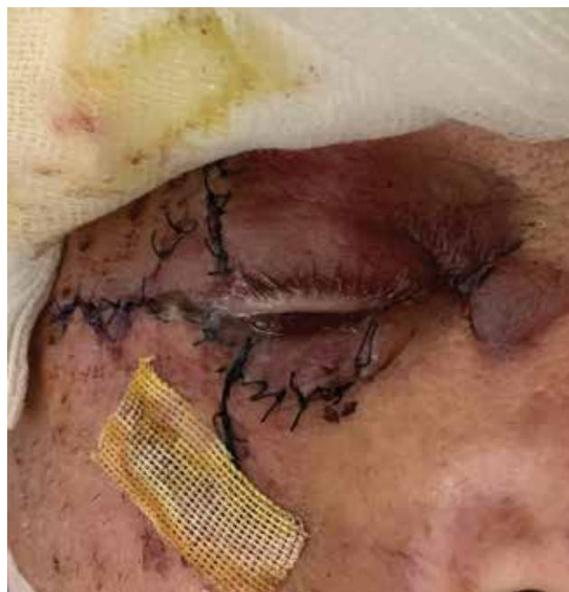
Obrázek 6-b. Nález při kontrole první den po rekonstrukci