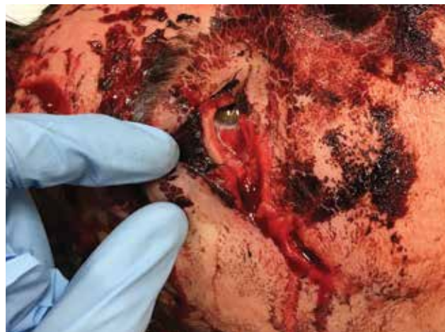
Obrázek 3-a. Otevřená rána zevního koutku, včetně vytrženého dolního kantálního ligamenta. Pacient po autonehodě