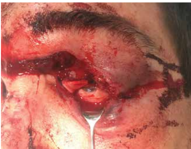
Obrázek 5-a. Profesionální poranění pilou. Rána na horním víčku je natolik hluboká, že došlo k poškození musculus levator palpebrae superioris

U všech traumat bychom měli ověřit, zda má pacient platné očkování proti tetanu a zda je rekonstrukci možné provést v lokální anestezii. Obecně ale platí, že pro rozsáhlá poranění víček, poranění slzných cest,