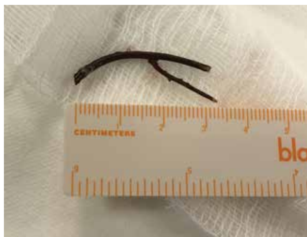
Obrázek 4-b. Extrahovaná větvička z přední části očníce

U kontuzí očníce je nutné pamatovat, že dle některých prací až 29,4 % může být spojeno s blow-out zlomeninou očníce [17]. Proto by tito pacienti měli být důsledně vyšetřeni včetně zobrazovací metody.