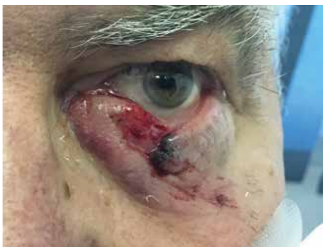
Obrázek 2. Tržné poranění dolního víčka, způsobené malým psím plemenem, bez poranění kanalikulu