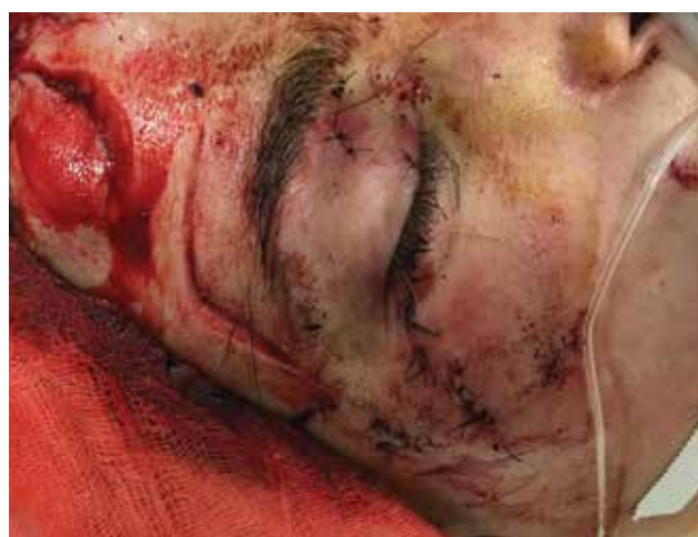
Obrázek 3-b. Stav po rekonstrukci víček oftalmologem