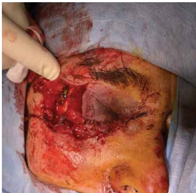
Obrázek 6-a. Těžké poranění očnice a víček při autonehodě. Je patrná již provedená rekonstrukce zlomeniny vnější stěny očnice stomatochirurgem