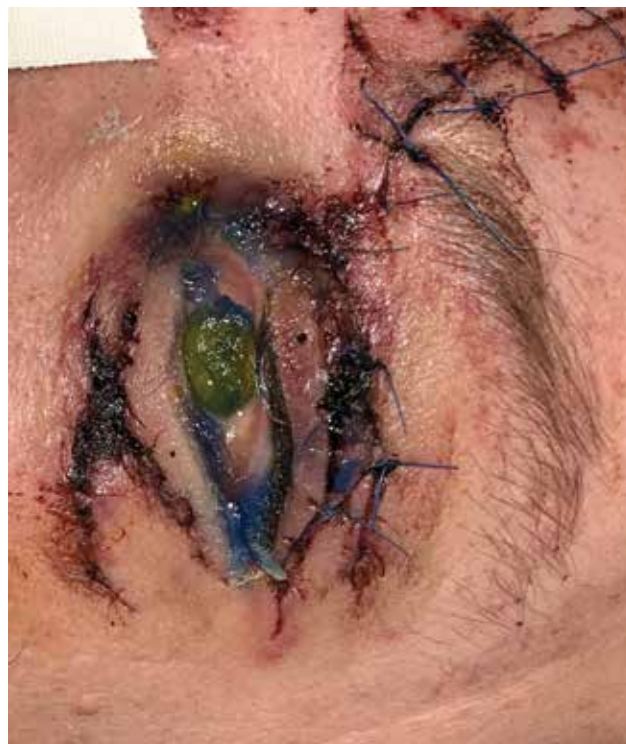
Obrázek 8. Fotografie ukazuje vzácnější komplikaci okuloplastických traumat – pacient po úraze (autonehoda) – pravděpodobně ztrátové poranění horního víčka po primární rekonstrukci – s nálezem expoziční keratitidy při lagoftalmu na podkladě nedovírání oční štěrbinu

Prevalence retrobulbárního hematomu se obecně pohybuje mezi 0,4–1,7 % [36,37,38].