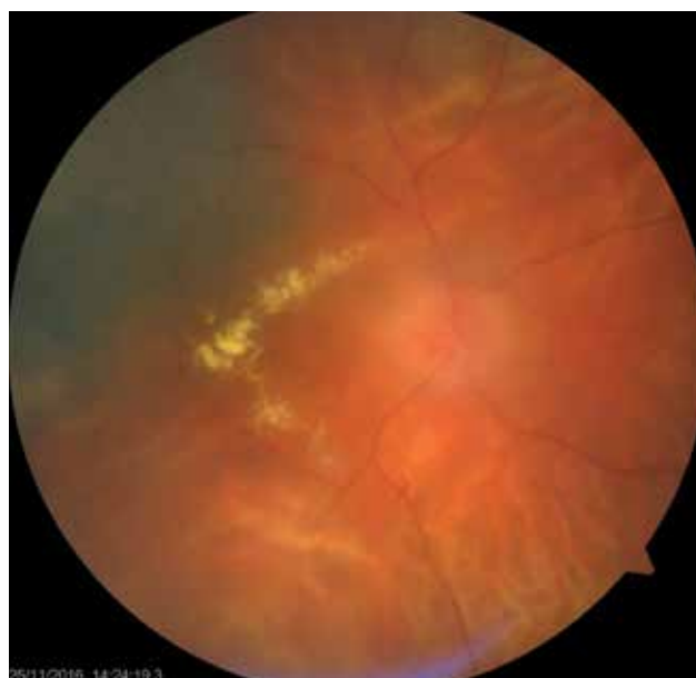
Obrázok 2. Pacient s postradiačnou optikoneuropatiou a makulopatiou

Na obrázku 3 a 4 je histopatologický nález recidivujúceho melanómu corpus ciliare u pacientky z nášho súboru