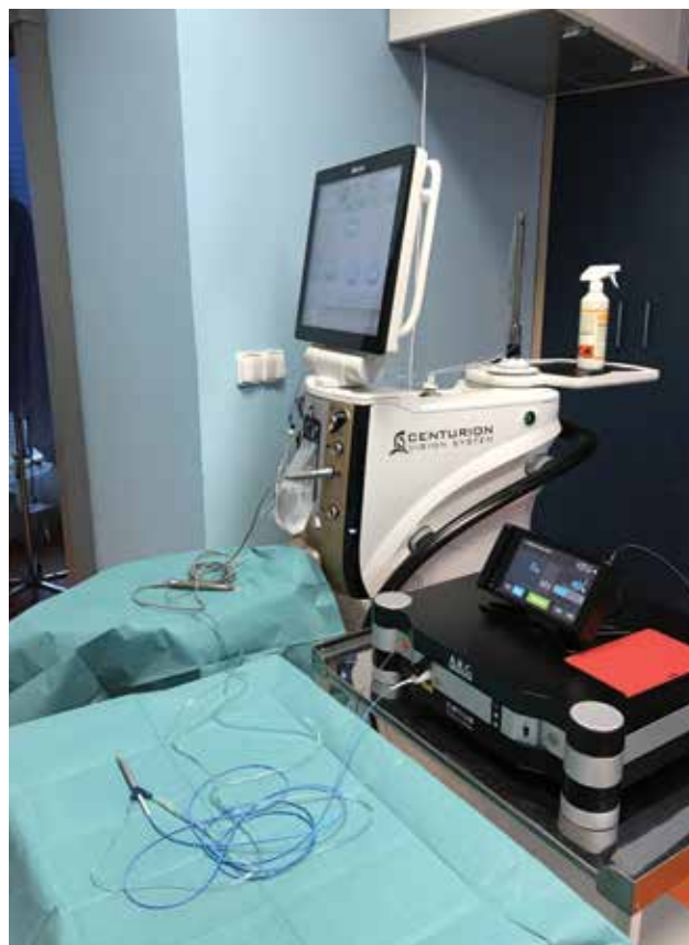
Obrázok 3. Pohľad na spojenie oboch prístrojov

Priemerné percento hexagonálnych buniek pred operáciou bolo v skupine I. 71,25 \pm 3,79\% , v skupine II. 69,75 \pm 4,35\% . Týždeň po operácii to bolo v skupine I. 68,50 \pm 4,52\% a v skupine II. 68,42 \pm 5,66\% . Zmeny boli v jed-