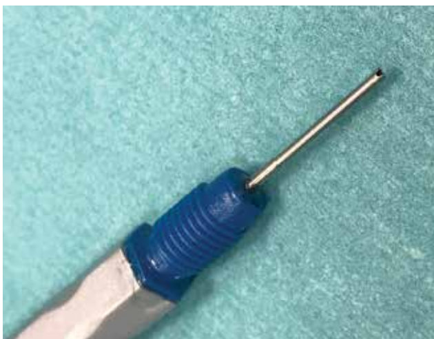
Obrázok 2. Detail koncovky Nanosekundového lasera

mentáciou šošovkových hmôt za pomoci irigácie a aspirácie.