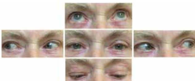
Obrázek 2. Úprava oftalmoplegie

Následná operace katarakty (v říjnu 2015 vpravo a březnu 2016 vlevo, s implantací zadněkomorové nitrooční čočky zlepšila nejlepší korigovanou zrakovou ostrost pravého oka z 0,5 na 1,0 a levého oka z 0,5 na 0,8 (Obrázek 1) – pseudophakie nativně a v arteficiální mydriáze). Nitrooční tlak je fyziologický bez nutnosti léčby. Celková i lokální léčba vedla k normalizaci neurologického a úpravě očního nálezu (Obrázek 2) – fyziologická motilita očí. Sledovací doba jsou tři roky.