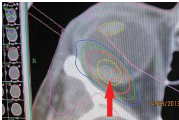
Obrázek 2. Stereotaktický plán ožiarenia ložiska v r. 2013