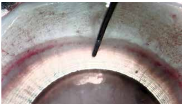
Obrázek 1. Otvor vytvořený pod DM před oddělením pomocí kapalinové bubliny

Zadní lamelární keratoplastika Descemetové membrány s endotelem (DMEK), kdy je transplantována pouze tenká Descemetová membrána (DM) s vrstvou endotelu se stává stále více populární pro chirurgické řešení Fuchsovy dystrofie a bulózní keratopatie [8] a je u těchto indikací považována za metodu volby. Separace DMEK štěpu je obvykle provedena opatrným seškrábnutím a sloupnutím DM z dárcovské rohovky [1,6]. Tento proces je časově náročný, vyžaduje vysokou zručnost a přináší nemalé riziko protržení membrány [2,8,15]. Nedávno se objevily nové metody, u kterých dochází k oddělení DM pomocí vzduchu/tekutiny injikované mezi DM a rohovkové stroma [9,13,14,16]. Přímé kapalinové oddělení pomocí jehly zasunuté mezi DM a rohovkové stroma je rychlý a jednoduchý způsob, který minimalizuje riziko roztržení membrány [11,16]. Navíc v průběhu oddělení pomocí kapaliny