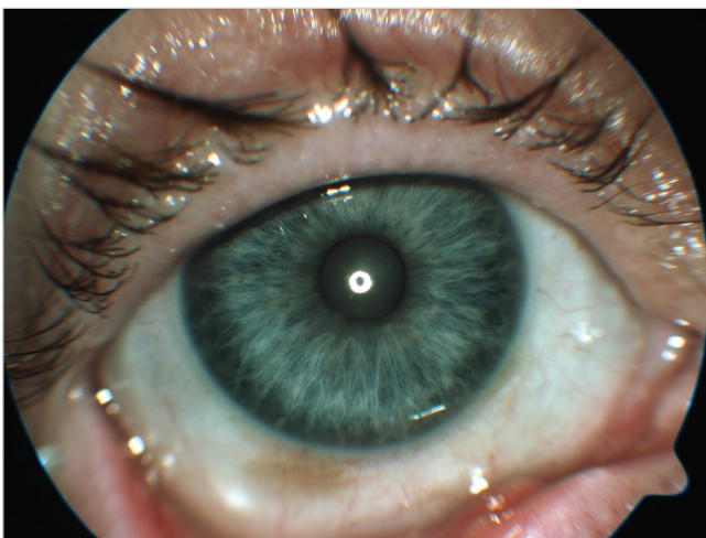
Obr. 3 Nález 3 týdny po zahájení substituce vitamínu A per os

oku byla 1,5 metru, na levém oku sporně bez světlocitu. Na pravém oku byl typický nález xeroftalmie včetně Bitotových skvrn (obr. 1), keratinizace a těžkého syndromu suchého