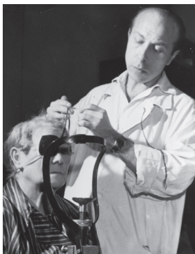
I. oční klinika v roce 1962